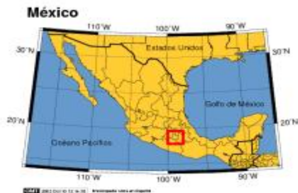
Localització de Morelos, estat d'origen de Zapata

Zapata es refugia a les muntanyes amb la seva muller i els seus fidels, en plena anarquia revolucionària. A instàncies de Villa assumeix el poder. En un moment determinat, rep un grup de pagesos que es queixen dels excessos del seu germà, nomenat, també, general. Emiliano Zapata, llavors, reclama enèrgicament el nom del qui encapçala la protesta. És en aquell moment quan se n'adona que això mateix és el que va fer Porfirio Díaz amb ell una dècada abans, i comprèn que està a punt de cometre les mateixes injustícies contra les que ha combatut. Zapata. Davant d'això, abandona el Palau de Govern i torna a casa seva amb els seus. El 19 d'abril de 1919 és assassinat, en una conspiració en la qual va estar implicat al que seria el nou president, Carranza.