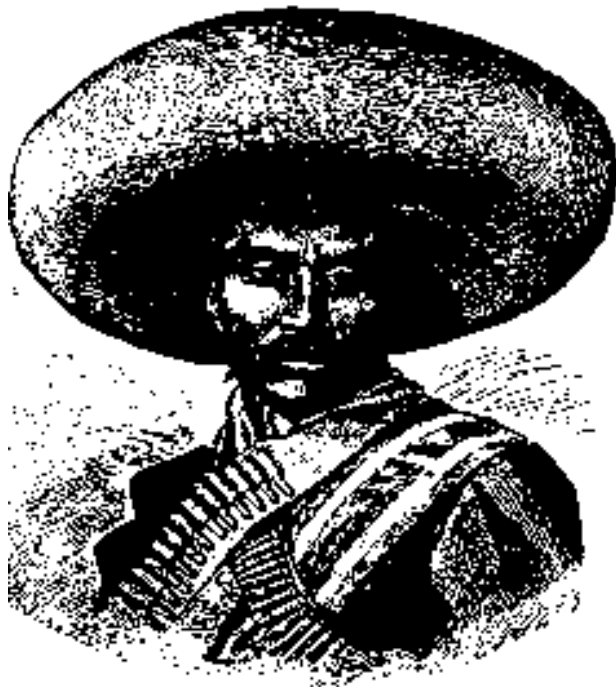
Emiliano Zapata, en un dibuix de l'època.