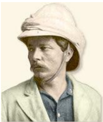
Henry Morton Stanley, 1872